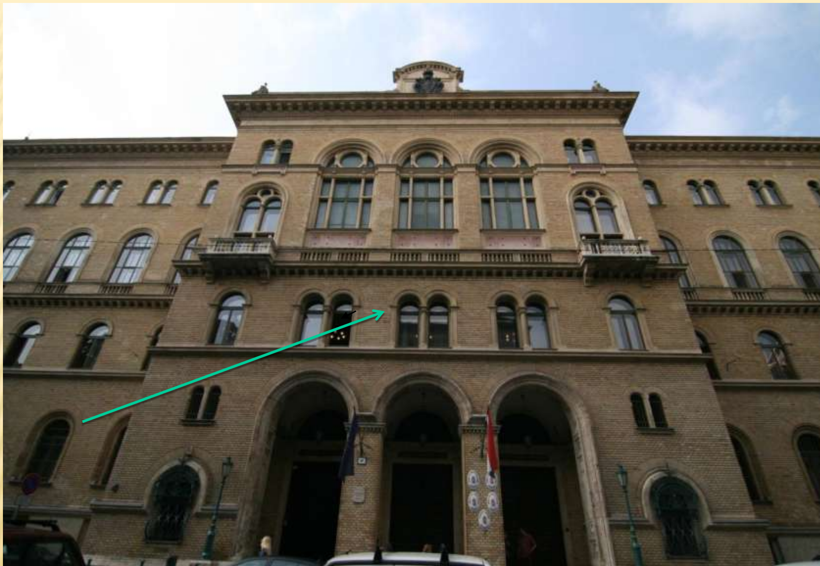
Budapest, V. Markó u. 27. I. emelet 37. könyvtár