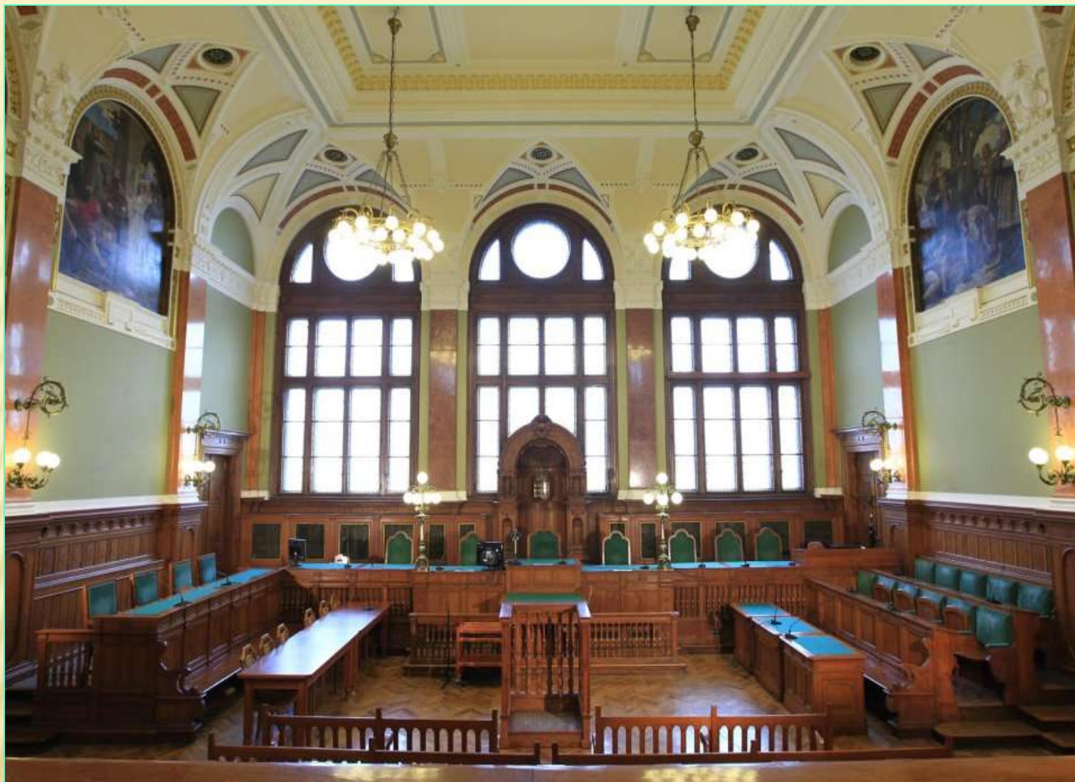
Feszty Árpád - táblaképek